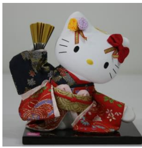
こんにちはキティ